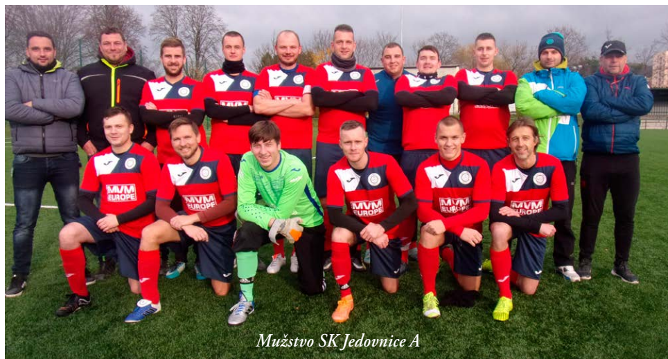
Mužstvo SK Jedovnice A