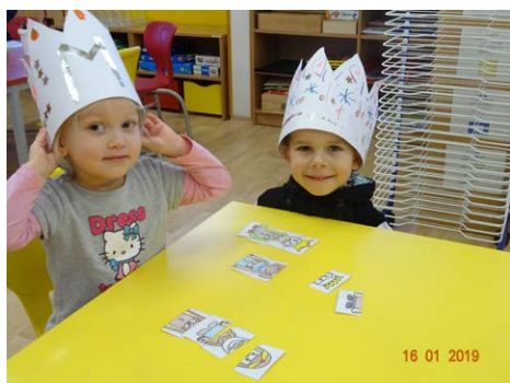
Skládáme obrázky králů z několika dílů.