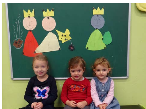
Vyrobili jsme tři krále a dary, které přinesli Ježíškovi.