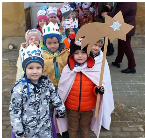
Vyrobili jsme královské koruny, pláště i hvězdu.