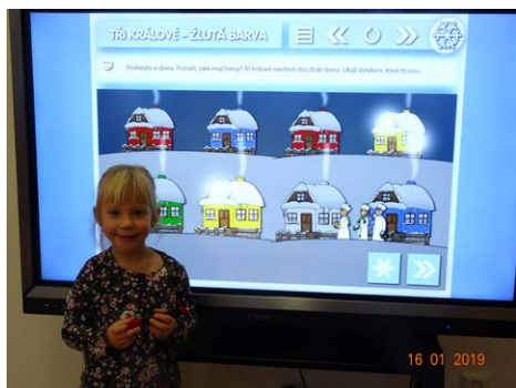
Učíme se znát barvy na interaktivním displeji.