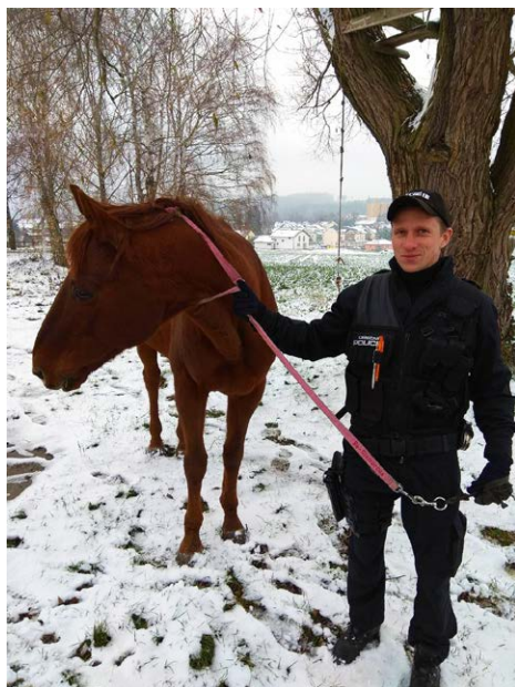
Nahoře: odchyt koně Vlevo: odstranění ledové námrazy