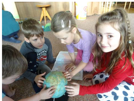
Hledali jsme na mapě cestu do Betléma.