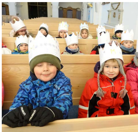
Navštívili jsme jedovnický kostel.