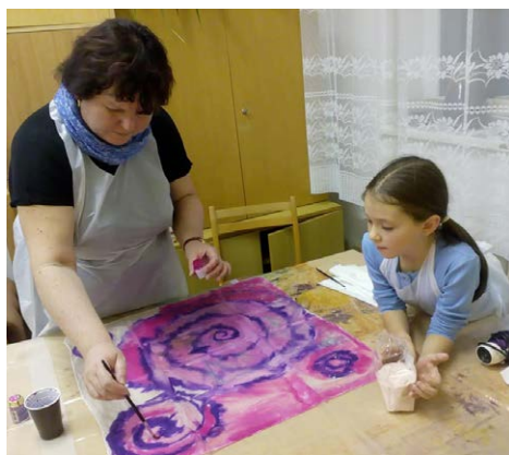
Účastnice kurzu malování na hedvábí - maminka a dcera