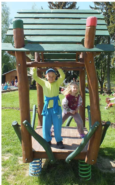
Pěkné slunečné dny si děti užívají aktivním pohybem a společnými hrami