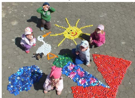
Třídíme víčka pro Plastožrouta a ještě z nich stavíme obrázky: složené logo mateřské školky