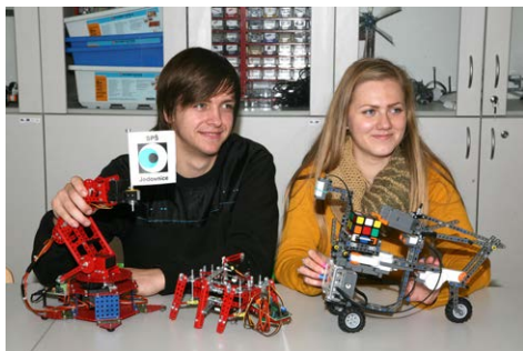
Průmyslováci staví programovatelné roboty z Lega a Merkuru

Záměrem školy je nahradit nevyhovující školní nábytek nábytkem novým. Pro příští školní rok se vybaví čtyři kmenové učebny budovy A, následovat bude výměna nábytku na budově B. Společně s nově zbudovanou pátou počítačovou učebnou zlepší průmyslovka svoje vybavení a žákům zpríjemní jejich pracovní prostředí.