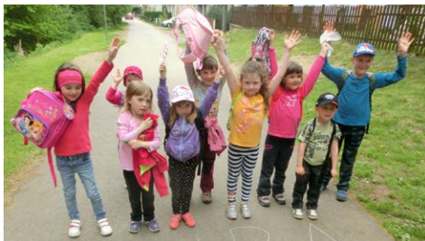
Děti ze třídy Kačenek, ze třídy Hastrmánek a ze třídy Kapříků