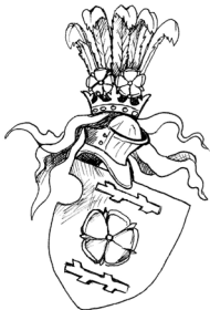
Jindřich ze Želetavy a Jedovnic