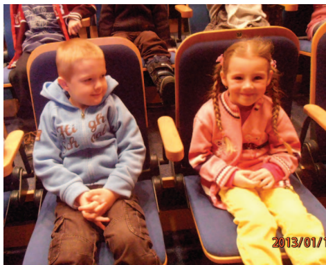
Děti v brněnském divadle Radost

Na začátku nového roku 2013 jsme se vydali do Brna, abychom se podívali, jak stejnou pohádku hrají profesionální herci v divadle Radost . Název představení zněl „ Tři čuníci nezbedníci “. Děti se velmi těšily. Obavy měly jen z vlka. Proslýchalo se o něm, že je strašidelný, má velkou sílu a brousí si zuby na čuníky. Vše začalo veselou písničkou - představením prasátek Pašíka, Vašíka a Boubelky, hrdinů známé pohádky. Zápletka byla stejná jako ta naše: aby se prasátka nestala kořistí vlka, musí si postavit bezpečný domeček. Sláma, dřevo nebo kámen budou tím pravým materiálem? Děti se výborně bavily. Když se objevil na scéně vlk, diváci v prvních řadách se zabořili hluboko do svých sedadel. Napětí bylo velké. Některé děti se raději přesunuly k paní učitelce. Vlk pouštěl hrůzu, ale za chvíli jsme pochopili, že moc chytros-