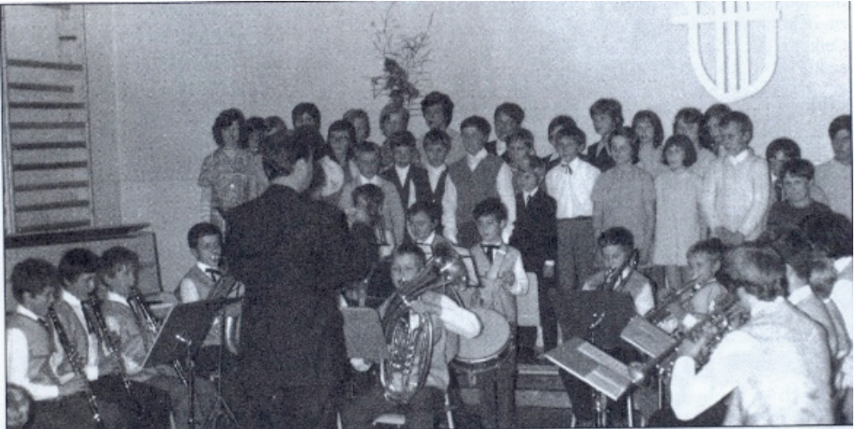
První vystoupení dechového souboru společně s dětským pěveckým sborem

Učitelé hudby vyučovali hře na devět druhů hudebních nástrojů - sólo, skupinově vedli přípravu hudební výchovy, hudební nauku, taneční oddělení, pěvecký sbor a dechovku, která